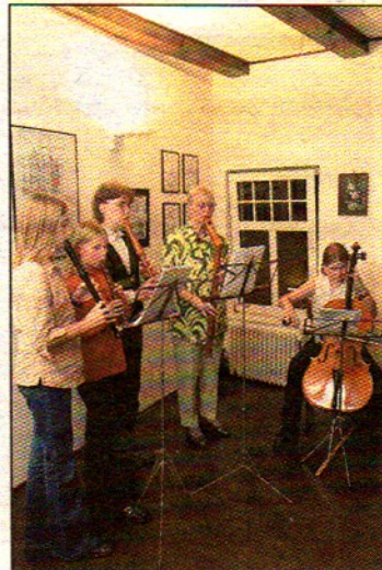
Gospel und Choräle gab es musikalisch.